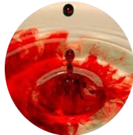
ماء سقط فيه دم